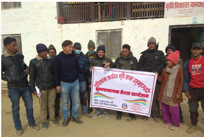
पालिका कृषि शाखा प्रमुख संगको बैठक