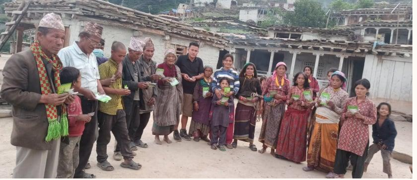
सहकारी मार्फत कृषि उद्यम (तरकारी बिउबिजन वितरण) सर्केगाड-१