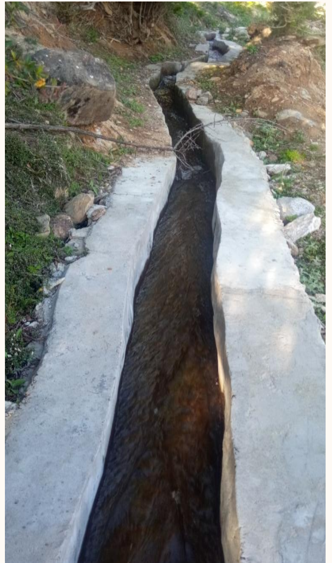
याल्बांग सिंचाई (नाम्खा-२)