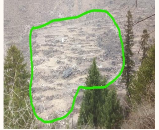
चक्लाबन्दी कार्यक्रम प्रस्तावित स्थान नाम्खा-१, हेप्का (कार्यक्रम संचालन हुनुपूर्व)