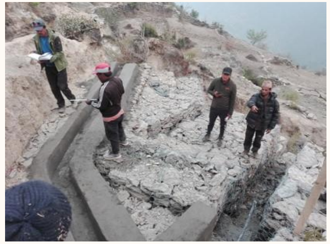
कृषि सिंचाई ताजकोट-३, ठुलासिम