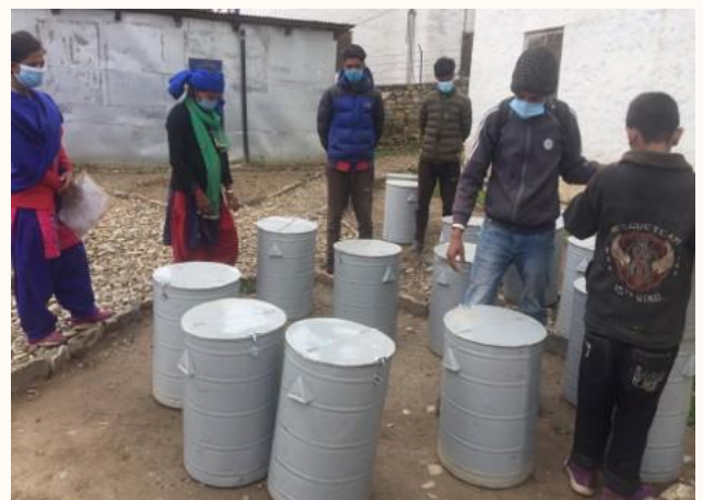
अर्गानिक मिसन कार्यक्रम अन्तर्गत कृषि उत्पादन तथा भण्डारण सामग्री वितरण