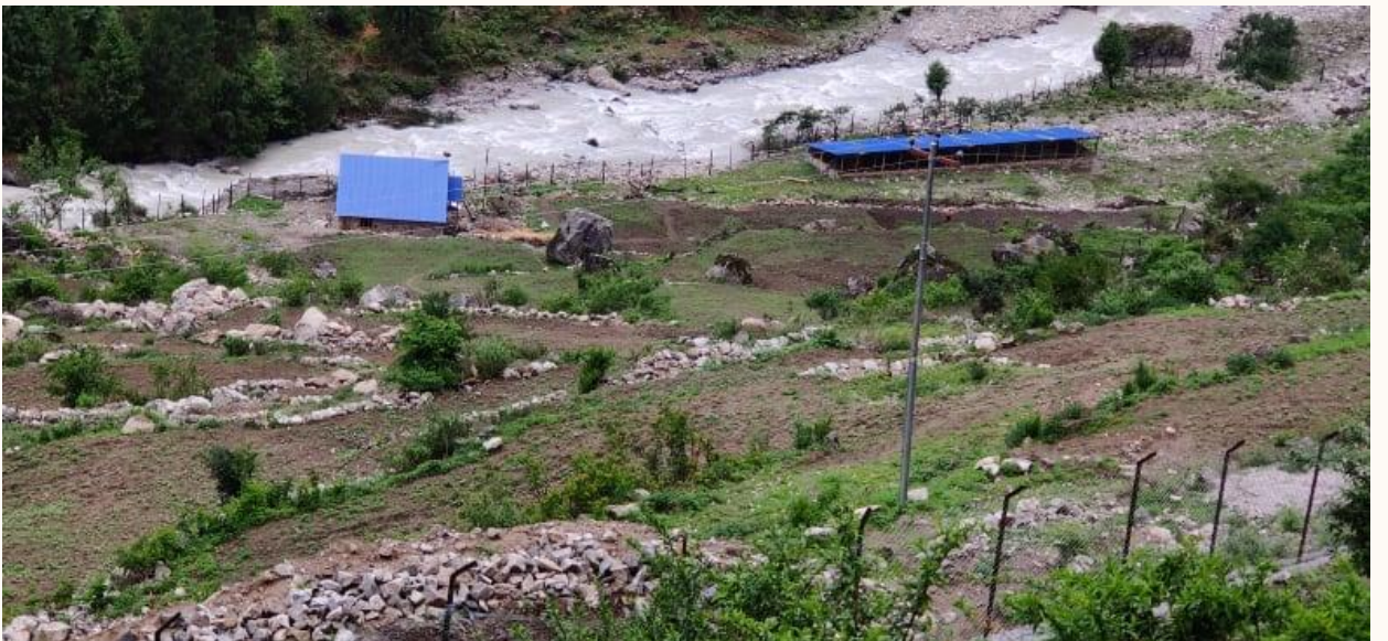
चक्लाबन्दी कार्यक्रम नाम्खा-१, हेप्का (कार्यक्रम संचालन संचालन भैसकेपछिको अवस्था)