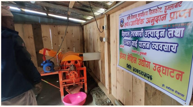
कृषि यान्त्रिकरण कार्यक्रमको एक झलक