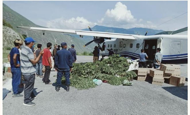
वर्षे फलफुल विरुवा ढुवानी बाजुरा एयरपोर्ट