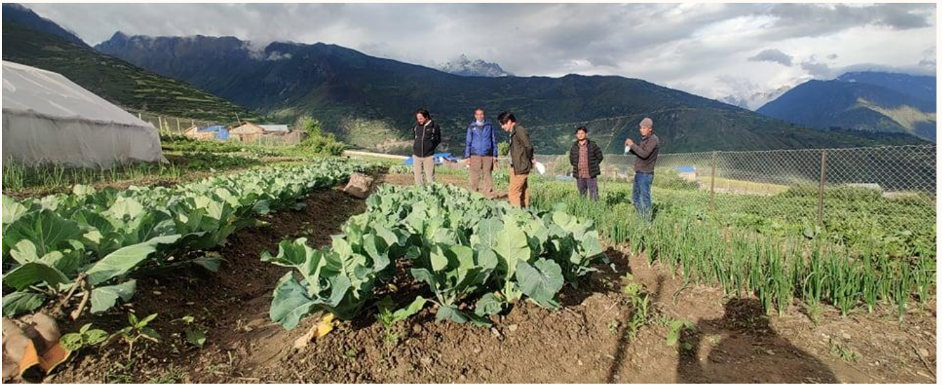
नर्सरी प्रवर्द्धन कार्यक्रम सिमकोट-६