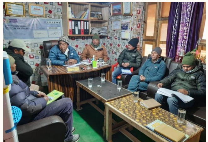
सिमकोट गापा अध्यक्षज्यु संगको बैठक