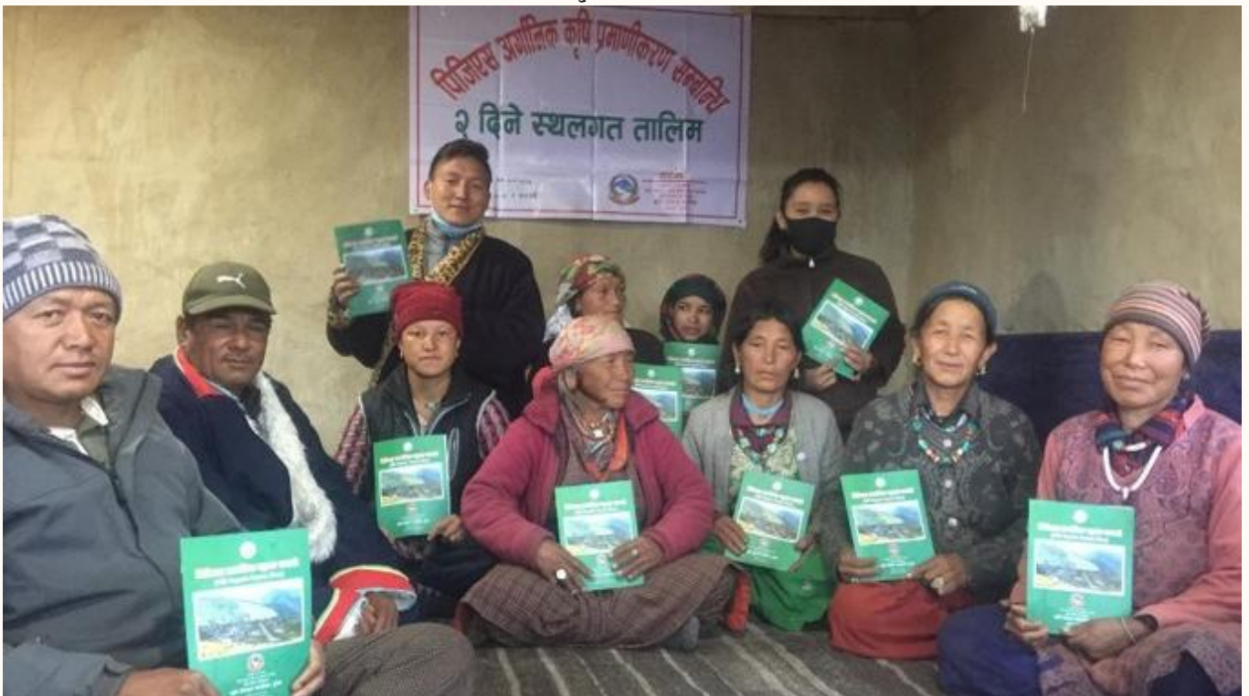
अर्गानिक मिसन कार्यक्रम अन्तर्गत संचालन भएका तालिमको झलक