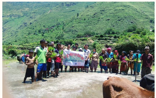
राष्ट्रिय धान दिवस (असार १५) २०७८ को झलकहरु