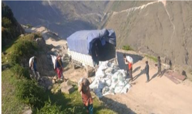
अर्गानिक मल वितरण कार्यक्रम ताजाकोट-२