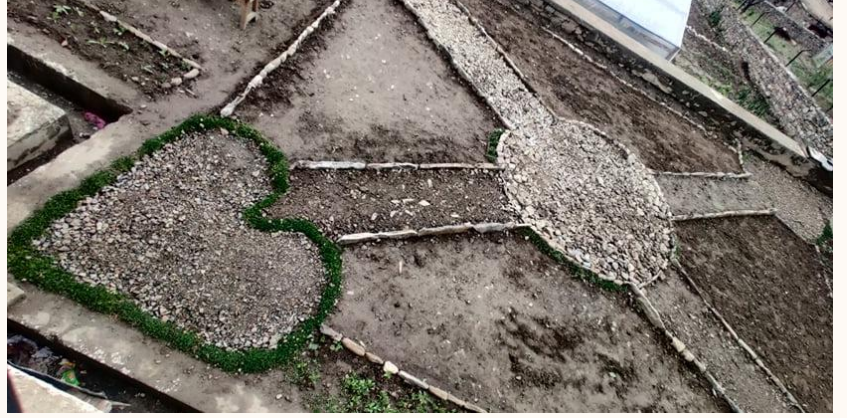
कार्यालय परिसरमा गाडेन नक्साकन

कृषि क्षेत्र विकासको लागि नेपाल सरकारको घोषित कृषि नीतिलाई कार्यान्वयनमा ल्याउन र हावापानी सुहाउदो खाद्यान्न, दलहन, तेलहन, नगदे र तरकारी जस्ता वाली हरुको उन्नत खेति प्रविधि कृषक सम्म प्रचार प्रसार तथा सेवा पुर्याउन प्रमुख निकायको रूपमा देशका अन्य विभिन्न जिल्लाहरुमा जस्तै एस हुम्ला जिल्लामा पनि २०३६ सालमा आएर जिल्ला कृषि विकास कार्यालय हुम्लाको स्थापना भयो । जिल्ला कृषि विकास