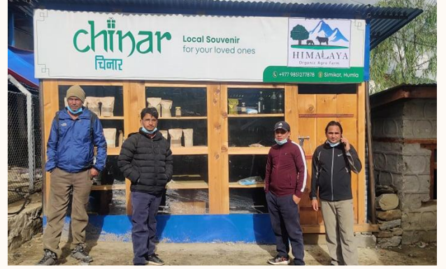
कर्णाली ब्रान्ड कार्यक्रम अन्तर्गत संचालन भएका कोशेली घरको केहि झलकहरु