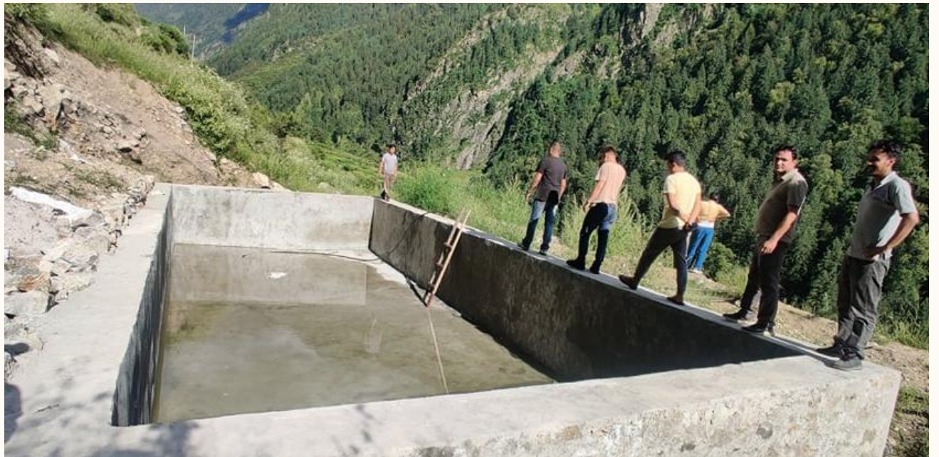
हेप्काटाकुरा कृषि सिंचाई नाम्खा-१ हेप्का

कृषि सिंचाई कार्यक्रम अन्तर्गत संचालन भएका केहि झलकहरु