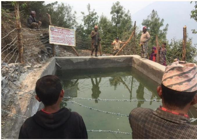
कृषि सिंचाई अदानचुली-३, रोकमा